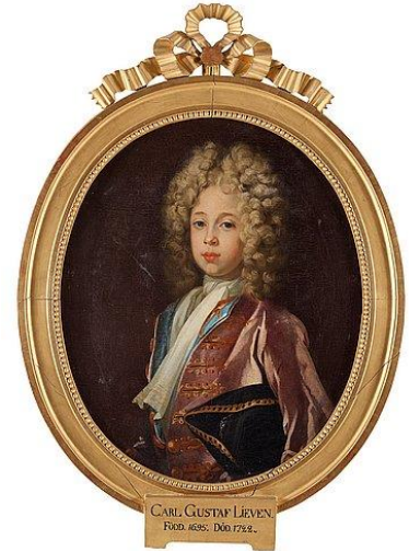
David von Krafft, Carl Gustaf von Liewen. Olja på duk.

Den andra donationen är ett själfullt porträtt av den unge Carl Gustaf von Liewen målat av David von Krafft..