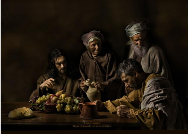
Andrea Angione: Cena in Emmaus.