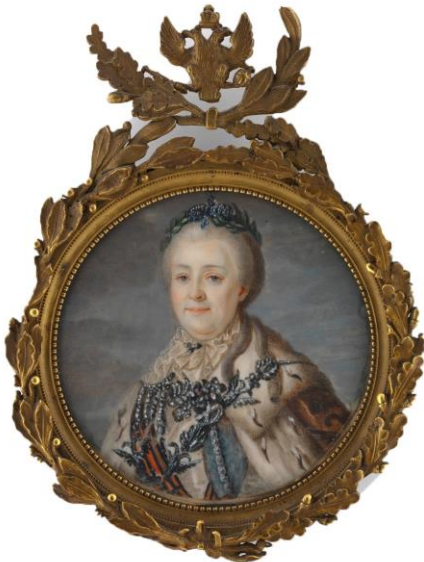
Efter Alexander Roslin, Katarina den Stora. Gouache på ben.