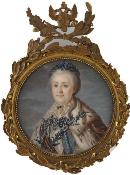
Alexander Roslinin mukaan, Katariina Suuri. Guassi luulle.