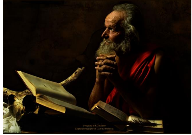
Andrea Angione: Vocazione di S. Girolamo

Hänen ensimmäinen valokuvanäyttelynsä Terribilis est locus iste oli esillä Palazzo Barberinissa Roomassa ja Galleria Permanentessa Milanossa vuonna 2009. Samana vuonna hän voitti Premio Arte Mondadori -palkinnon valokuvauksesta. Näyttelyt Nec spe nec metu (Porto Ercole, 2010) ja Fortitudo Mea in Luce (Capalbio, 2011) olivat menestyksiä ja nostivat Andrea Angionen myös suuren yleisön tietoisuuteen Italiassa.