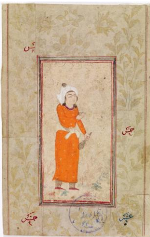
Persialainen miniatyyri, 1500-luvun loppu – 1600-luvun alkupuoli.

I oktober öppnar samtidigt två specialutställningar, Taidesalonki – Konstsalongen 100 år samt den italienska nutidskonstnären Livio Ceschins grafikutställning Spår av det förflutna- Grafik av Livio Ceschin . Utställningarna är öppna 8.10.2015.–10.1.2016 .