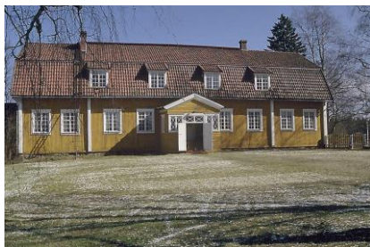
Huvudbyggnaden på Frugård. Bild: Kirsti Kovanen 1988. http://kirjasto.mikkeli.fi/etela-savon-kartanot/index.php?page=joroinen

Anmälan till sekreteraren från och med 4.4.2016 kl. 14.00 på adressen ystavat.siff@fng.fi eller tel. 045 106 8484 (mån 14-16). Efter att ni fått bekräftelse på er anmälan kan ni betala deltagaravgiften på föreningens konto S Bank IBAN FI65 3636 3010 1431 21, referens "Herrgårdsresa", sista betalningsdagen 9.5.2016 .