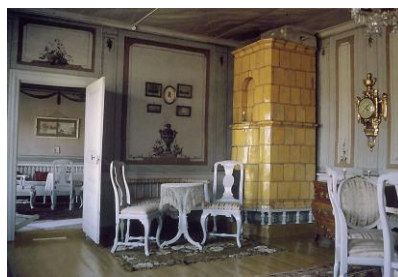
Huvudbyggnaden på Frugård, Bild: Kirsti Kovanen, 1988 http://kirjasto.mikkeli.fi/etela-savon-kartanot/index.php?page=joroinen