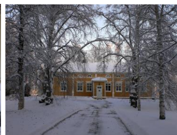
Huvudbyggnaden på Örnevik gård.