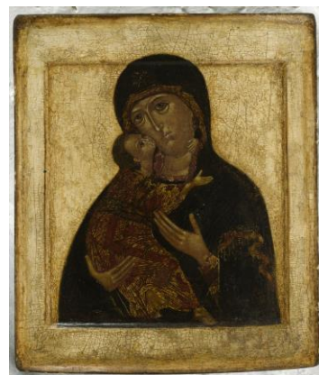
Rysk ikon, 1600-talet. Finlands Nationalgalleri..

I allmänhet är ikonmålaren okänd. Skadorna på de äldsta ikonerna har reparerats flera gånger, men ikonens motiv har förblivit detsamma. Kristus, Gudsmoan och helgonen avbildas alltid enligt de regler som traditionen diktarar. De äldsta ikonerna på utställningen är från 1500- och 1600-talen och representerar i huvudsak ryskt ikonmåleri. Ikonerna ingår i Konstmuseet Sinebrychoffs samlingar.