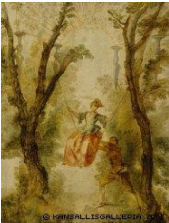
Antoine Watteau: Gungan.

Sammanlagt nästan 7500 antal besökare såg den historiska och tematiskt mångbottnade utställningen, som rönte mycken uppskattning.