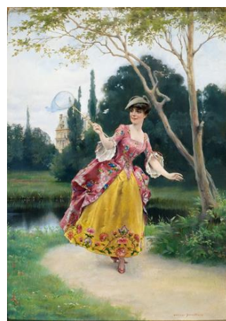
Gunnar Berndtson: Trädgårdssidyll Stiftelsen för Åbo Akademi, Museet Ett Hem, Åbo.