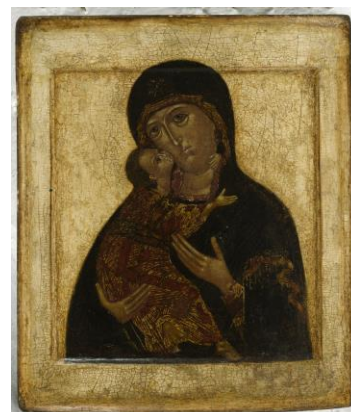
Venäläinen ikoni, 1600-luku. Kansallisgalleria.

Ikonit kuuluvat itäeurooppalaiseen, Bysantiin pohjautuvaan taideperinteeseen. Ikonitaiteen juuret ulottuvat varhaiskristilliseen taiteeseen. Ikonin ensisijainen tehtävä kulttikuvana on säilynyt elävänä ortodoksisen kirkon piirissä vuosisatojen läpi. Uskonnollisessa yhteydessä ikoni on rukouksen välikappale, mutta sitä voi myös tarkastella kauniina, temperavärein maalattuna taideteoksena.