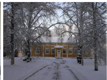
Örnevikin kartanon päärakennus.